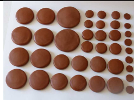
kit 39 pierres d'argile

https://www.ludion-massage.com/petite-etuve-p-66.html