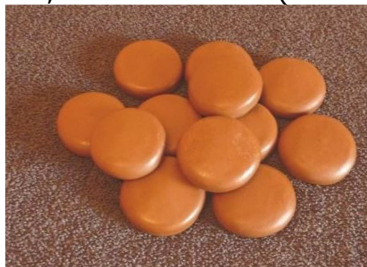
Kit 12 pierres froides tarif indicatif 30€

Afin de pouvoir mettre en pratique ce que vous avez appris à l'issue de certaines formations, il vous appartiendra d'acquérir du matériel spécifique détaillé ci-dessous. Ce matériel pourra être acquis sur place le jour de la formation, ou inclut dans le tarif de formation, suivant la session (voir contrat d'inscription)